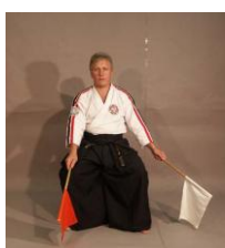
Фото № 63