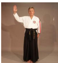
Фото № 34