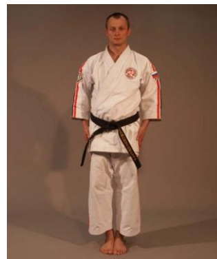
Фото № 73

Форма одежды спортсменов, принимающих участие в соревнованиях (см. фото №73), состоит из, непосредственно, «Karate Gi» с полосами: две полосы красного и черного цвета идут по бокам брюк каратэги и по внешней стороне рукавов. Ширина полос составляет 10 мм, а расстояние между полосами – 5 мм. Очередность расположения полос следующая: первой располагается красная полоса, за ней идет черная. Karate Gi дополняется поясом «Obi», цвет которого соответствует квалификации спортсмена. На куртке на левой стороне груди на уровне сердца располагается эмблема международной спортивной федерации. На правом рукаве куртки симметрично этой эмблеме располагается эмблема национальной спортивной федерации. В области спины (по специальному письменному разрешению Оргкомитета соревнований) может располагаться логотип официального спонсора команды. Сзади на куртке ниже уровня пояса «Obi» может располагаться номер участника соревнований, который присваивается после прохождения мандатной комиссии и жеребьевки. Перед началом поединков все спортсмены должны надеть защитное снаряжение «Anzen Bogu» (см. фото №74). Цвет защитного шлема определяется результатами жеребьевки пар спортсменов. Обязательно использование защиты на пах «Kin Ate», защитных накладок на руки и защитных накладок на ноги (голень и подъем стопы). В отдельных случаях только по решению врачей и судейской бригады допускается использование эластичных бинтов на голень, колено, локоть в случае получения спортсменом травмы.