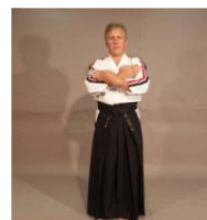
Фото № 41