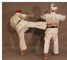
Фото № 13