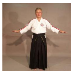
Фото № 56