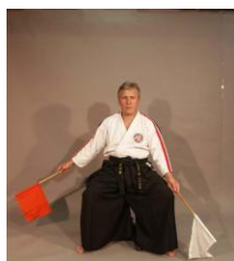
Фото № 58