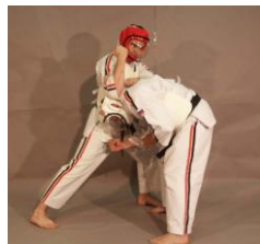
Фото № 8