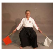
Фото № 70