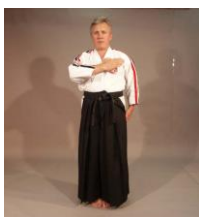
Фото № 26