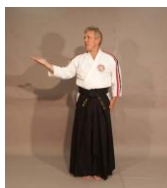
Фото № 22