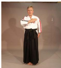
Фото № 29