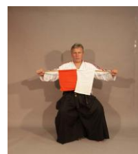
Фото № 67