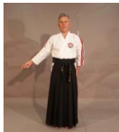
Фото № 24