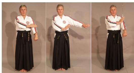
Фото № 52