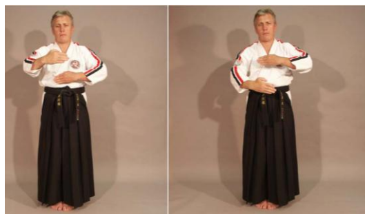
Фото № 49