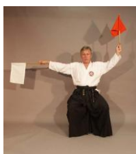
Фото № 65