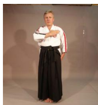
Фото № 33