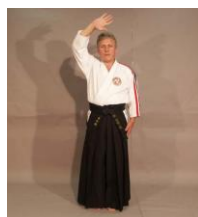
Фото № 36