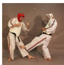
Фото № 15