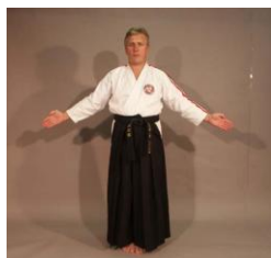
Фото № 53