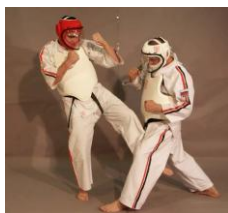
Фото № 14