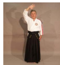
Фото № 37