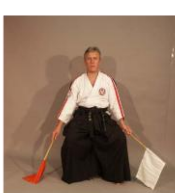
Фото № 71