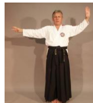
Фото № 39