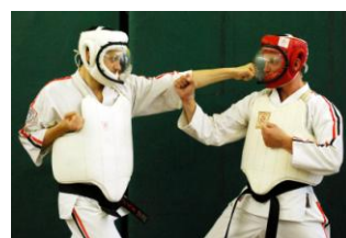
Фото № 74