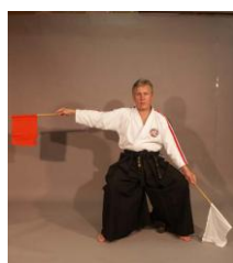
Фото № 59