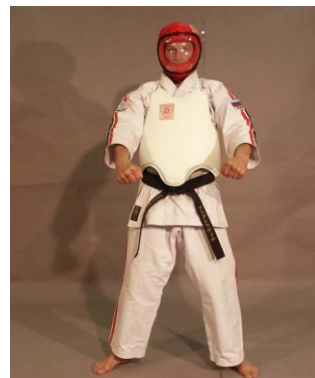
Фото № 75

Все участники соревнований должны быть одеты в оригинальную защитную экипировку (японской фирмы «Суперсэйф» или российской фирмы «Рэй-спорт»), состоящее из протектора туловища белого цвета, протектора головы красного или белого цвета и протектора паха (см. фото №75), который одевается под кимоно. Женщины – участницы соревнований имеют право использовать дополнительной защиты груди. Обязательно использование защитных накладок на руки и на ноги (голень и подъем стопы), утвержденные Главной Судейской Коллегией. Рекомендуется использование капы для защиты зубов.