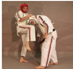
Фото № 9