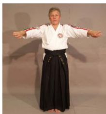
Фото № 55