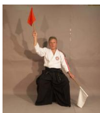
Фото № 64