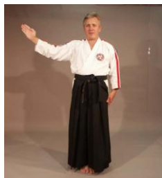
Фото № 30