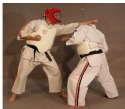
Фото № 12