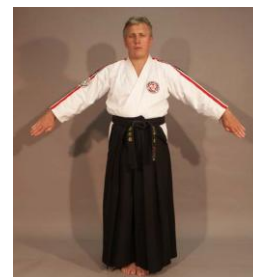
Фото № 44

Данная команда дается после остановки поединка командой « Yame! ». Она дается в случаях: показа спортсменами неэффективной техники, которая не может быть оценена, в случае сумбурной техники; если спортсмены пытались применять друг против друга бросковую технику, которая не была эффективной; если один из спортсменов вошел на ближнюю дистанцию, захватил соперника, удерживает его, мешая продолжать бой; если поединок был остановлен для проведения совещания судей, но совещание не определило вынесения зачетных или штрафных очков. Команда « Torimasen » подается Рефери также и в том случае, если окончилось время поединка, перед определением победителя. Таким образом, Рефери показывает, что в последнем эпизоде поединка не было проведено засчитываемых технических действий. Команда « Torimasen » не предполагает вынесения каких-либо решений или присуждения зачетных очков.