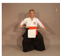
Фото № 69