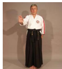
Фото № 17