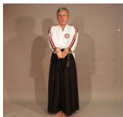
Фото № 54