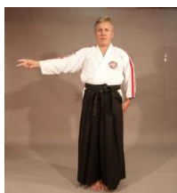
Фото № 27