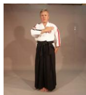
Фото № 23