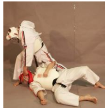
Фото № 10