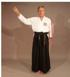
Фото № 31