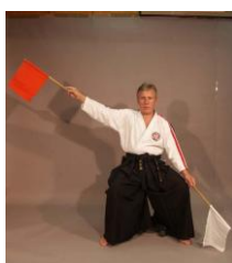
Фото № 60