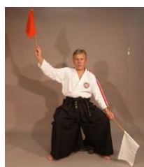
Фото № 61