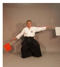
Фото № 66