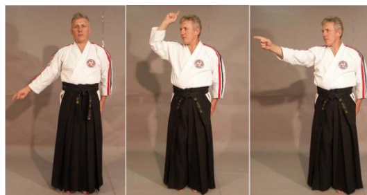
Фото № 45 Фото № 46 Фото № 47

1 очко. Рефери сначала показывает указательным пальцем в сторону ног спортсмена, покинувшего площадку, произнося при этом команду « Aka / Shiro Jogai Chui! !». После этого другому спортсмену присуждается 1 очко. В ходе поединка может случиться так, что оба спортсмена покинули в результате проведения технических действий площадку. В этом случае рефери вправе присудить обоим спортсменам по « Jogai Chui » и присвоить им по 1-му очку. Если выход за татами стал результатом сумбурных, нерезультативных действий, то рефери должен остановить поединок, вернуть спортсменов на их исходные позиции и потом продолжить поединок. Правила не ограничивают количество возможных выходов за линию площадки.